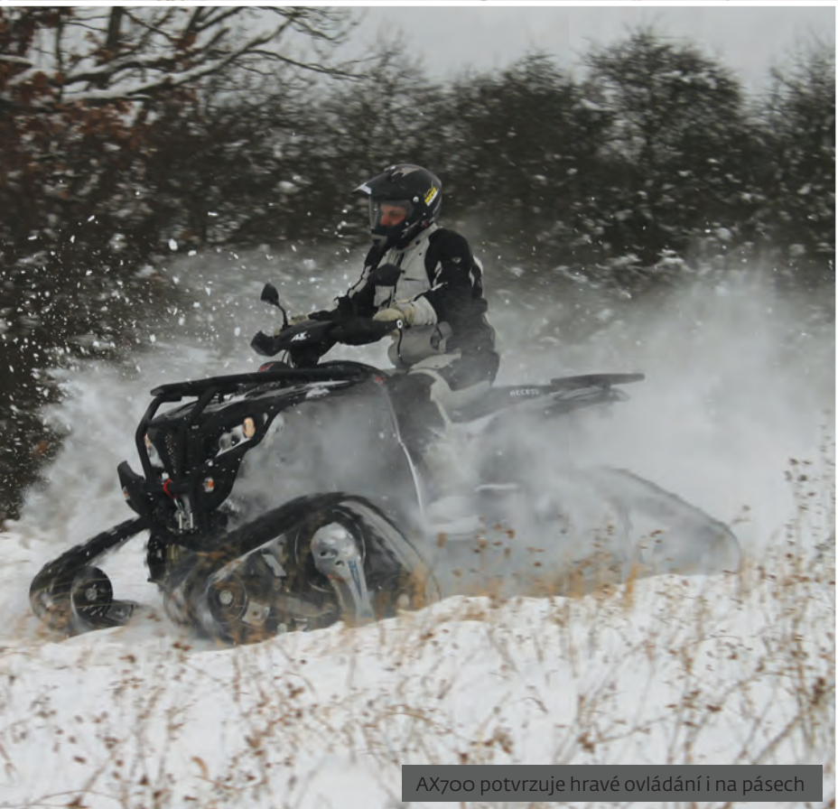
AX700 potvrzuje hravé ovládání i na pásech